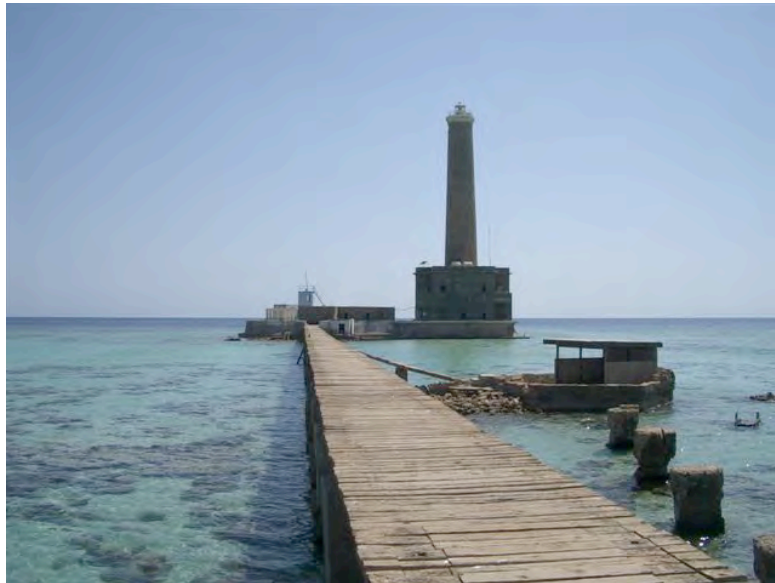
SUDAN – FARO DI SANGANEB REEF