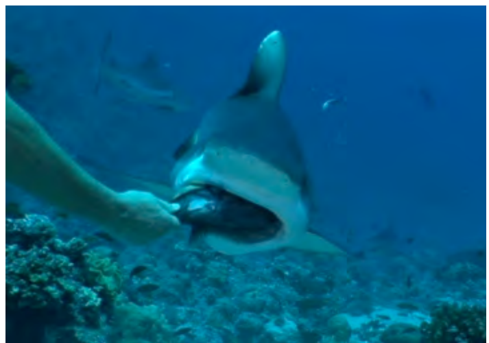
SUDAN – FOTO GERARDO FORNARI

E anche qui a punta sud di Sha' ab Rumi, considerata una delle più belle immersioni al mondo, fuori al fioritissimo pianoro, nel blu, sotto i 35 metri, si farà l'aspetto per gli squali i martello !!!!!!!!!