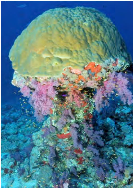
SUDAN – FOTO FABIO CIORBA